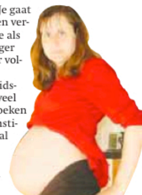
Naar de verloskundige.

Denk daarbij niet alleen aan foliumzuurtabletten, maar ook aan roken, alcohol, medicijnen en omstandigheden op je werk. Daarom pleit dit adviesorgaan van de regering voor het invoeren van een zogenoemd 'preconceptieconsult', een gesprek bij de verloskundige of huisarts om alle aspecten te bespreken.